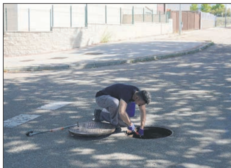
Uno de los técnicos realizando tareas de desinsectación y control de plagas en Torrijos en una tapa de alcantarilla.

En definitiva, la localidad ha recibido el respaldo de la administración provincial mediante una inversión cercana a los 2,7 millones de euros desde el año 2023. Estas partidas, canalizadas a través de diferentes planes y programas institucionales, permiten mantener el ritmo de actualización en los servicios e infraestructuras de las calles Loto y Tulipán y otras zonas estratégicas del municipio.