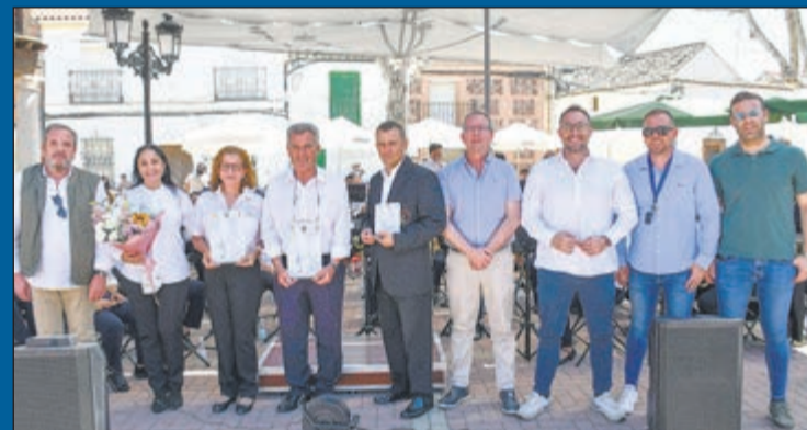
La banda de Pelahustán participó en un encuentro de bandas en Numancia de la Sagra • El municipio de Numancia de la Sagra albergó recientemente un destacado encuentro de bandas en Numancia de la Sagra con motivo de la celebración del trigésimo aniversario de la Asociación Musical "San Marcos". El evento principal consistió en un concierto extraordinario interpretado de forma conjunta por la banda anfitriona y la Banda Municipal de Pelahustán "Asociación Musical La Picota".