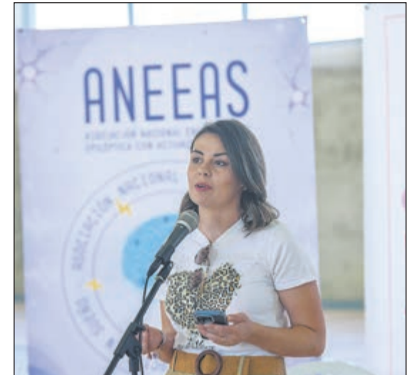
El pabellón reservó un espacio preferente para el debate, la sensibilización institucional y el análisis de la situación sociosanitaria actual.