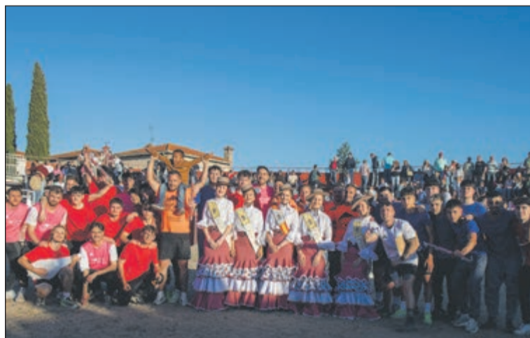
El buen tiempo favoreció la alegría y diversión de los vecinos de Santa Olalla durante las Fiestas en honor a Nuestra Señora de la Piedad.

Santa Olalla celebró sus Fiestas Mayores en honor a Nuestra Señora de la Piedad con una amplia programación de actos tradicionales, actividades festivas y participación vecinal. Durante varios días, la localidad reunió a vecinos y visitantes en torno a una de las celebraciones más señaladas del calendario municipal.