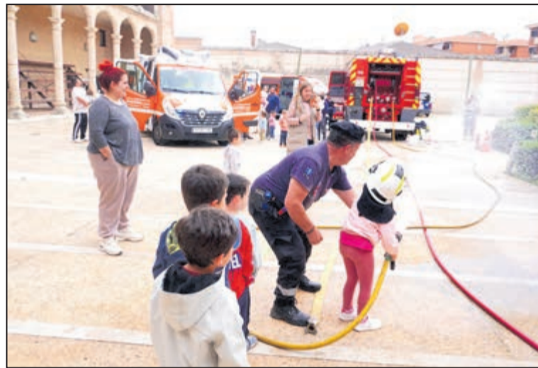
La Semana de la Familia ha contado con la colaboración del Ayuntamiento de Torrijos, Protección Civil y Ambulancias Finisterre.