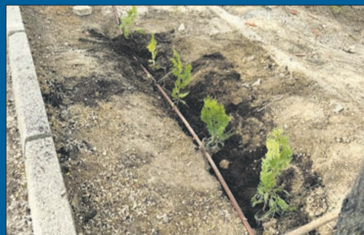
Comunidad educativa y Ayuntamiento se unen para concienciar sobre el cuidado ecológico. La jornada de reforestación se estructuró como una actividad cooperativa donde los escolares, asistidos por personal cualificado y por sus propios profesores, asimilaron los conceptos metodológicos de la siembra y los posteriores riegos de consolidación que precisan las especies introducidas.