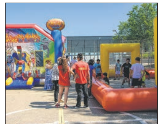
La respuesta colectiva en Quismondo demostró la urgencia de invertir en la investigación médica de dolencias minoritarias.