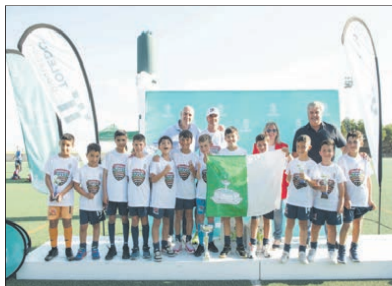
Fuensalida volvió a ser el centro futbolístico de la comarca.

La cita deportiva volvió a poner de relieve el trabajo de la Escuela Municipal de Fútbol y la implicación de jugadores, entrenadores y familias, y que ya en el anterior Torneo de Fútbol de Semana Santa llegó a reunir a cerca de 200 jóvenes deportistas en una jornada.