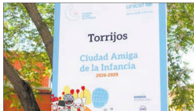
El Ayuntamiento ha instalado las nuevas placas conmemorativas en el parque de San Gil, la Escuela de Música y la calle Tejar.

de UNICEF exige a las administraciones asegurar un entorno seguro y protector, además de fomentar la implicación real de los niños en las decisiones de la vida municipal a través del Consejo de Infancia y Adolescencia. En este sentido, la localidad se alinea con las directrices internacionales para dotar a los jóvenes de herramientas que impulsen su bienestar social.