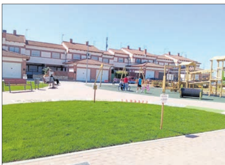
La Mata abrió la primera fase del nuevo parque en la calle Vereda del Monte, equipado con juegos infantiles.

El proyecto general contempla la ampliación progresiva de las zonas verdes y estanciales del área recreativa. En definitiva, la apertura parcial del nuevo parque en la calle Vereda del Monte constituye un avance en las políticas locales de adecuación de espacios destinados a la infancia, garantizando entornos accesibles que promueven la actividad física al aire libre dentro del término municipal de La Mata.