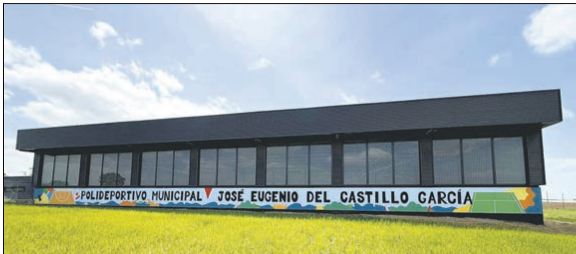
Los trabajos se centran en la renovación de la pista polideportiva y el pabellón del complejo deportivo municipal

Las obras se centran especialmente en el tratamiento de superficies. En la pista polideportiva exterior, se está procediendo al saneamiento del firme para aplicar posteriormente un revestimiento de resinas de alta resistencia. En definitiva, se busca optimizar el agarre y la dura-