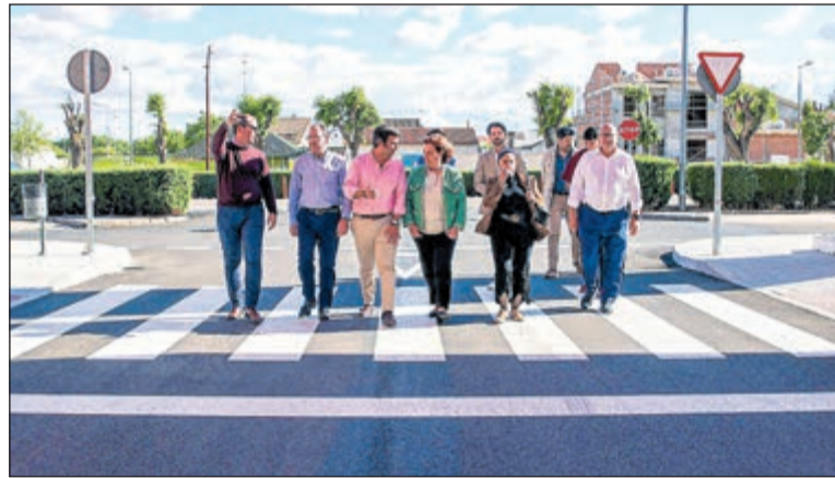
El alcalde de Torrijos y la presidenta de la Diputación de Toledo visitaron las obras finalizadas en las calles Loto y Tulipán.