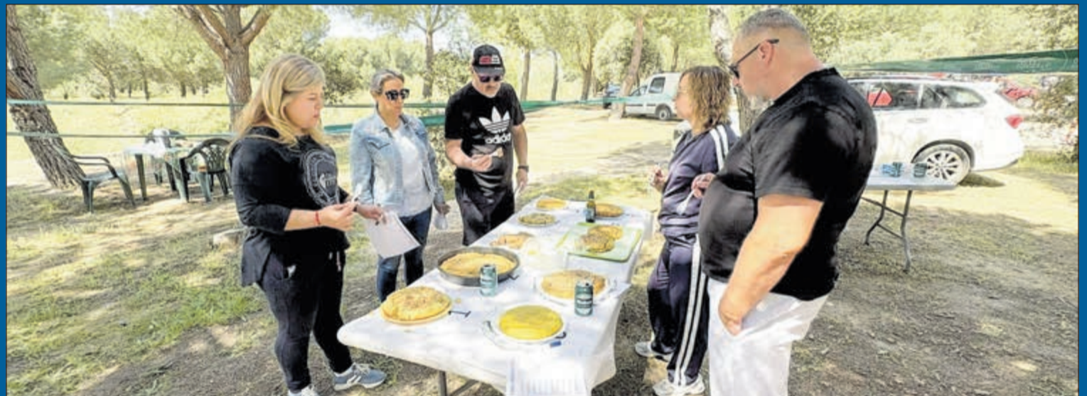
Camarena celebró la tradicional Junta de San Marcos en el Prado Palacios. El Prado Palacios volvió a acoger la tradicional Junta en honor a San Marcos, una de las citas populares vinculadas a la convivencia vecinal en Camarena. La jornada reunió a vecinos del municipio en torno a actividades populares, música, el Torneo de Petanca y el Concurso de Tortillas, manteniendo el carácter participativo y vecinal de esta tradición local.

Desde el Consistorio trasladaron su agradecimiento público a la junta directiva de la hermandad, así como al cuerpo de voluntarios, cocineros y colaboradores que hicieron posible el correcto desarrollo del evento. La celebración del día de San Isidro se consolidó como uno de los referentes del calendario festivo de la comarca.