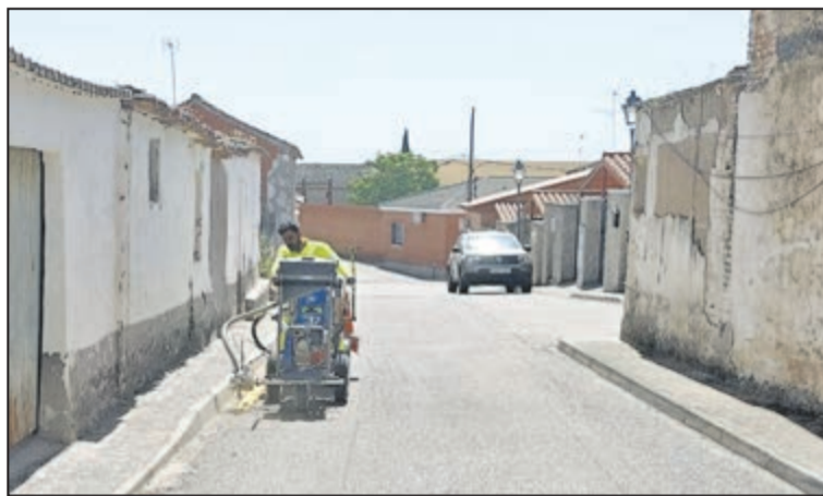
La Diputación de Toledo financia la nueva señalización vial en Rielves

La ejecución integral de este proyecto ha sido viable gracias a la estrecha colaboración y al respaldo económico de la Diputación de Toledo. En este sentido, la institución provincial mantiene firme su compromiso de seguir contribuyendo al mantenimiento y la modernización de las infraestructuras y los servicios públicos en las distintas localidades de la provincia.