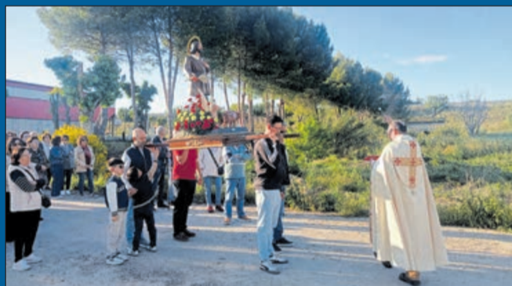
Rielves recupera sus tradiciones en San Isidro. Rielves acogió los actos conmemorativos organizados con motivo de la festividad de San Isidro. El evento se desarrolló en un ambiente festivo y de hermanamiento, consolidando una jornada marcada por la convivencia, las tradiciones y el arraigo cultural de la población local. La celebración de San Isidro en Rielves congregó a numerosos residentes con el objetivo de mantener vivas las costumbres que definen la historia y la identidad de la localidad.

En definitiva, desde el consistorio municipal se ha emitido un recordatorio dirigido a toda la ciudadanía. En él se subraya la vital importancia de respetar de forma estricta la renovada señalización vial en Rielves y las normas generales de circulación. La administración local confía en que la colaboración vecinal sea la clave para consolidar unas vías públicas más eficientes, accesibles y libres de incidentes para todos los usuarios.