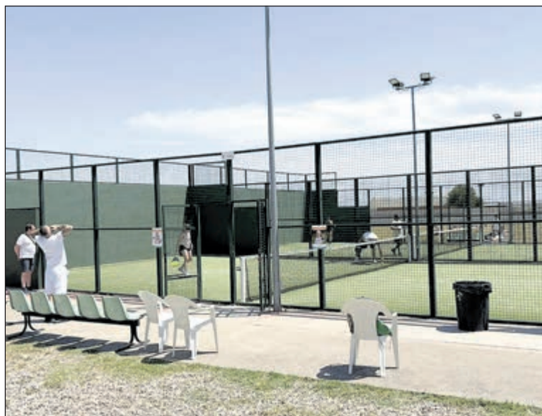
Camarena reúne deporte y solidaridad en su Torneo de Pádel.