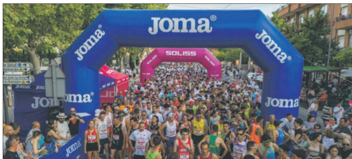
La 'marea rosa' teñirá Fuensalida con la Carrera Nocturna de ADAF.