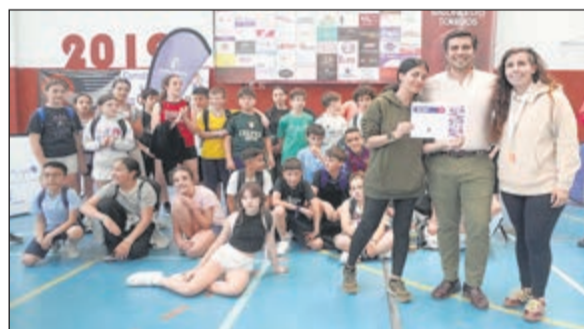
El proyecto venía promovido por la Consejería de Educación, Cultura y Deportes de la JCCM y la Federación de Baloncesto de Castilla-La Mancha (FBCLM).

disciplina del baloncesto. En este sentido, la metodología aplicada permitió que los escolares no solo ejercieran como jugadores dentro de la cancha, sino que también