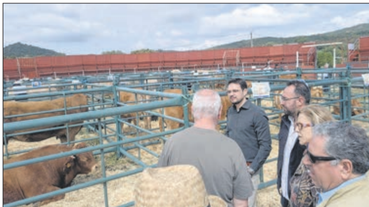
Pelahustán cerró su Feria Ganadera con más de mil asistentes.

La Feria Ganadera de Pelahustán ha vuelto a situar a este municipio de la provincia de Toledo como punto de encuentro para profesionales del sector ganadero, vecinos y visitantes procedentes de distintos puntos de la región. A lo largo de todo el fin de semana, la localidad ha acogido diversas actividades centradas en el sector primario, combinando exposiciones de ganado, propuestas divulgativas y actividades de ocio dirigidas a todos los públicos.