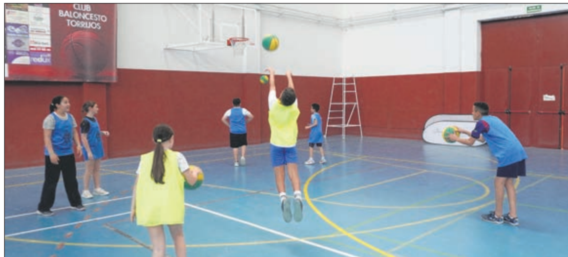
Los escolares disfrutaron de la fase local del programa Quijo3x3 en Torrijos, una jornada de baloncesto para fomentar valores y hábitos saludables.