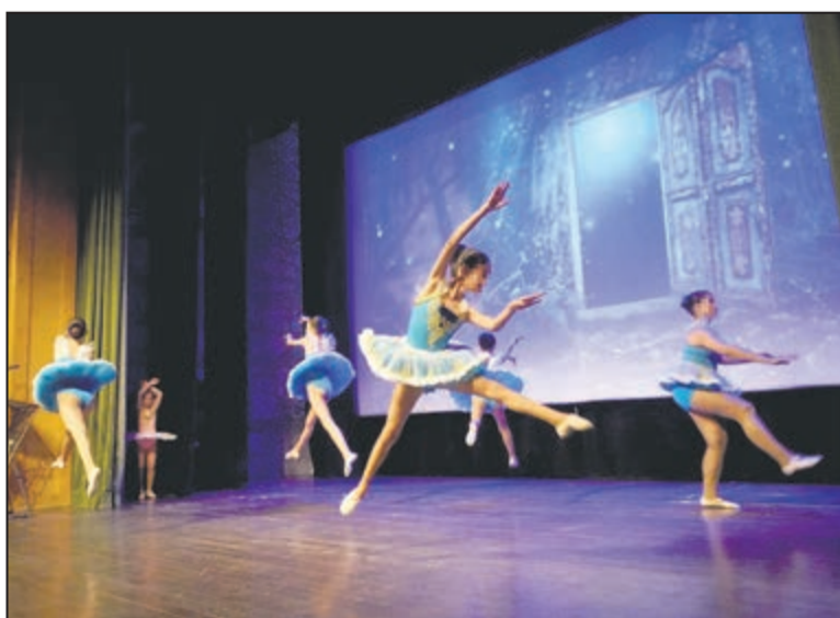
El Palacio de Pedro I acogió el festival de la Escuela de Música y Danza de Torrijos con la participación de 170 alumnos de todas las edades.

Durante ambas comparecencias públicas, los estudiantes de la escuela expusieron ante los asistentes las destrezas teóricas y musicales adquiridas a lo largo de todo el curso formativo. De este modo, el alumnado dispuso de un espacio regulado para la práctica interpretativa y escénica en un entorno profesional. Así mismo, la dirección de la escuela coordinó los diferentes bloques y niveles educativos para ofrecer una panorámica completa de las enseñanzas del centro.