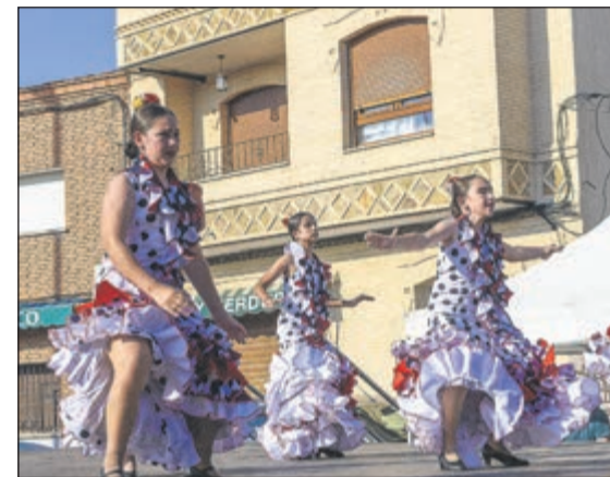
La Feria de Primavera de Camarena reunió el pasado sábado a escuelas de baile de la comarca.