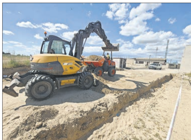
Las labores actuales se centran en el movimiento de tierras y en la adecuación de los viales.