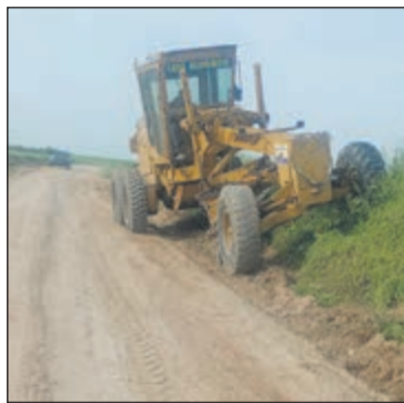
Operarios de la Diputación realizando trabajos de mejora.