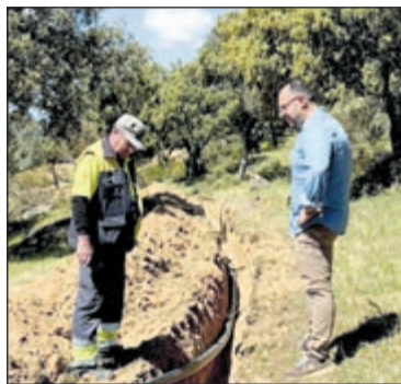
La renovación de la red hidráulica de Pelahustán soluciona las deficiencias de presión en las zonas altas de la localidad.