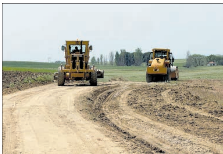
Las labores de acondicionamiento incluyen el perfilado de cunetas, el rasanteo de las superficies y el aporte de materiales en los tramos más deteriorados por el uso y las inclemencias meteorológicas.