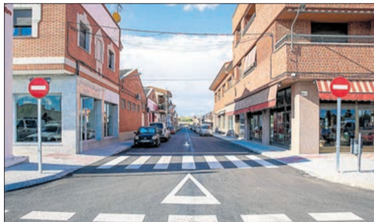
Esta actuación forma parte del plan de modernización de infraestructuras que la institución provincial impulsa en la localidad.

Esta actuación en las calles Loto y Tulipán da respuesta a una reivindicación de los vecinos y empresarios tras más de 30 años de espera. Los trabajos ejecutados de acerado, asfaltado y repavimentación han permitido adaptar estas vías a las necesidades actuales de seguridad y accesibilidad. En este sentido, las obras han dispuesto de un presupuesto global de 240.000 euros. La Diputación