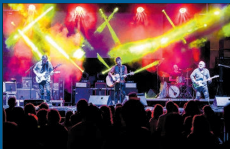
Torrijos vibró con los clásicos de Tam Tam Go. La mítica banda pacense ofreció un espectáculo diseñado para conectar a diferentes generaciones, interpretando sus temas más reconocidos de los años 80 y 90. El evento demostró el enorme interés que sigue despertando el pop-rock español y la gran respuesta del público ante las propuestas de ocio organizadas en el municipio.